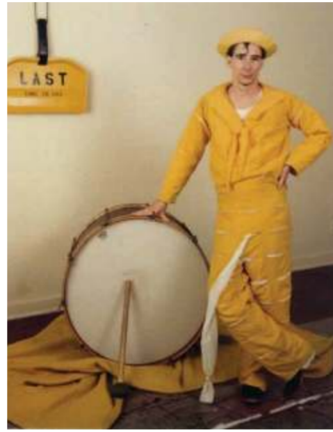
Mike Kelley, Banana Man Costume, 1981.

Mike hield erg van film en video, daar hadden we het elke dag over. Hij zag ook parallellen tussen een kunstenaar en een