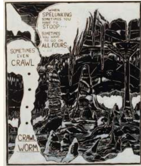
Mike Kelley, Exploring II , 1986, acryl op doek, collectie de Bruin-Heijn

entertainer. In de tentoonstelling is de video te zien, samen met het kostuum. Het is behoorlijk vies nu. We dachten, zullen we het schoonmaken? Maar nee. Het is juist mooi dat je ziet dat het gebruikt is, met vlekken en al.”