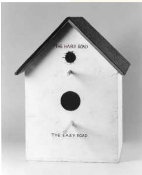
Mike Kelley, Catholic Birdhouse , 1978, geverfd hout. Privécollectie, New York.

Ik heb in de Gagosian twee installaties gekocht: Switching Marys en Black Curtain .