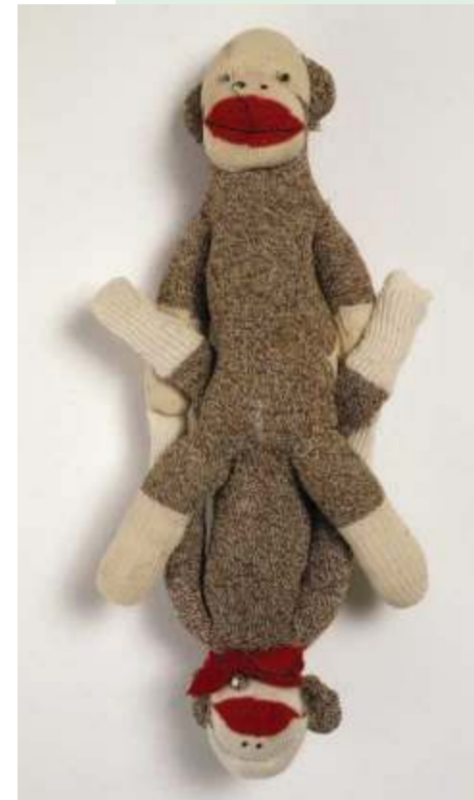
Mike Kelley, Estral Star #3 , 1989, samengebonden knuffelbeesten. Ringier Collectie, Zwitserland.

CONSERVATOR STEDELIJK MUSEUM OVER ESTRAL STAR #3 :