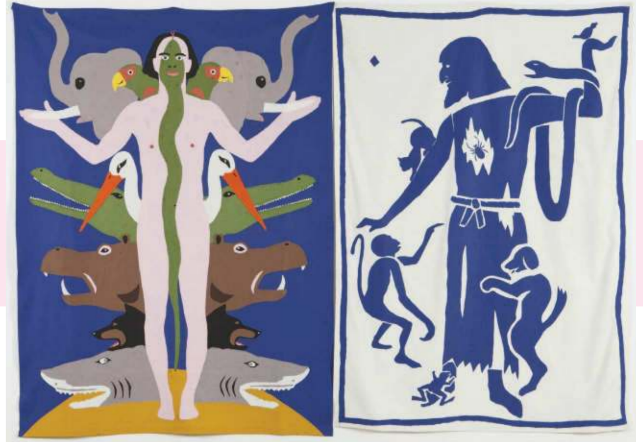
Mike Kelley, Animal Self / Friend of Animal, 1987, vilt, twee delen. The Schyl Collection, Malmö Kontshall.

Na een bezoek aan de dierentuin van Los Angeles maakte Kelley zijn serie Monkey Island (1982-83). De gelijknamige installatie bestaat uit werk op papier, in allerlei vormen en formaten. Abstract wisselt hij af met gekke, karikaturale afbeeldingen van dieren. Monkey Island gaat over de overeenkomsten tussen mensen en dieren, en de aard van de menselijke seksualiteit. Kelley brengt van alles bij elkaar: wezens, plekken, materialen, biologische structuren en andere fenomenen.