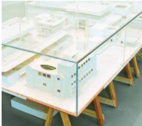
Mike Kelley, Educational Complex (detail), 1995, acryl, latex, foam, glasvezel, hout. Collectie Whitney Museum of American Art.

overleden was. Het is zo zonde dat hij er een einde aan heeft gemaakt... Het laat me wel zien: you have to somehow keep your cool . Het is tenslotte soms al moeilijk om een mens te zijn, laat staan een kunstenaar. Het kan allemaal zeer intens worden, zeker als succes tot zulke hoogten stijgt.