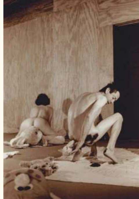
Mike Kelley, Nostalgic Depiction of the Innocence of Childhood , 1990, zwart-wit foto in sepia. Courtesy Mike Kelley Foundation for the Arts

“Heel terecht dat hij zo'n groot retrospectief krijgt in het Stedelijk”