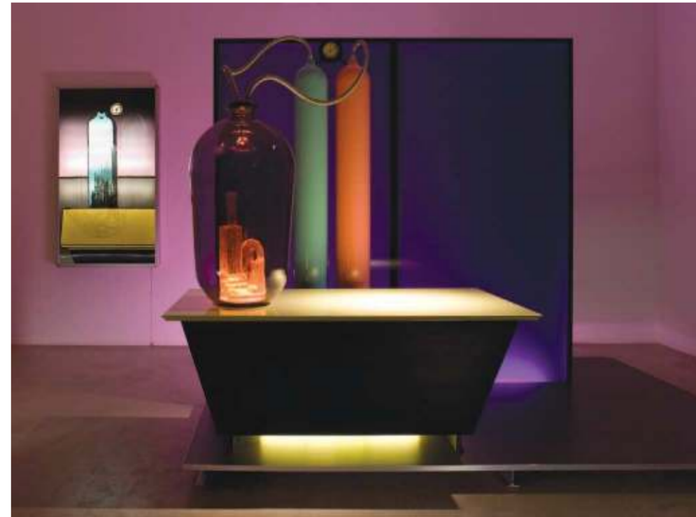
Mike Kelley, Kandor 15 , 2007, mixed media en video projectie, editie 2/2.

durft adolescentie als onderwerp te nemen en zichzelf in anderen te verplaatsen. Mike Kelley is niet alleen belangrijk omdat hij een kunstenaarschap vertegenwoordigt dat autoriteit, godsdienst, kitsch en de familie belicht, maar ook omdat hij de psychologische worsteling van de 'geaccepteerde' kunstenaar in de 21ste eeuw belichaamt.”