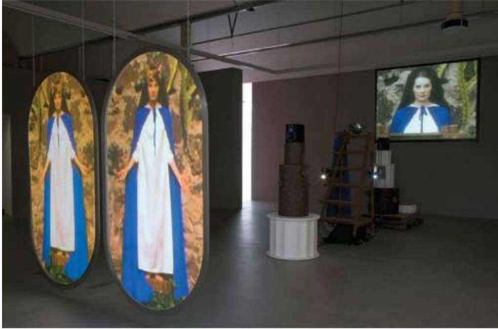
Mike Kelley, Switching Marys, 2004-2005, installatie. Collectie Stedelijk Museum, Amsterdam.