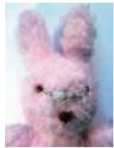
Mike Kelley, Ahh... Youth!, 1991, foto (detail)

“Ik woonde in Boston, waar ik de kunst-academie deed. In 2005 heb ik toen Mike Kelleys Day Is Done -tentoonstelling gezien in de Gagolian Gallery in New York. Wat een indrukwekkende ervaring was dat... Het was voor het eerst dat ik zijn werk ergens zag. It totally grabbed me . Hoe hij allerlei trieste ervaringen herhaalde en verdraaide, en in verschillende stukken opdiende. Het was een soort freaky nachtmerrie. Ik maakte zelf videokunst dus ik wist hoeveel beslissingen je daarin te nemen hebt. Ik was ook aan het kijken hoe een mix te maken van sculptuur, installatie en video. Zijn tentoonstelling liet