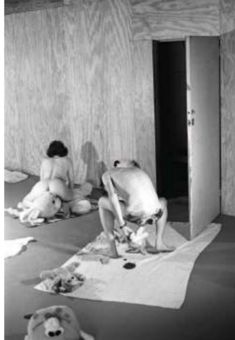
Mike Kelley, Manipulating Mass-Produced Idealized Objects , 1990, zwart-wit foto.