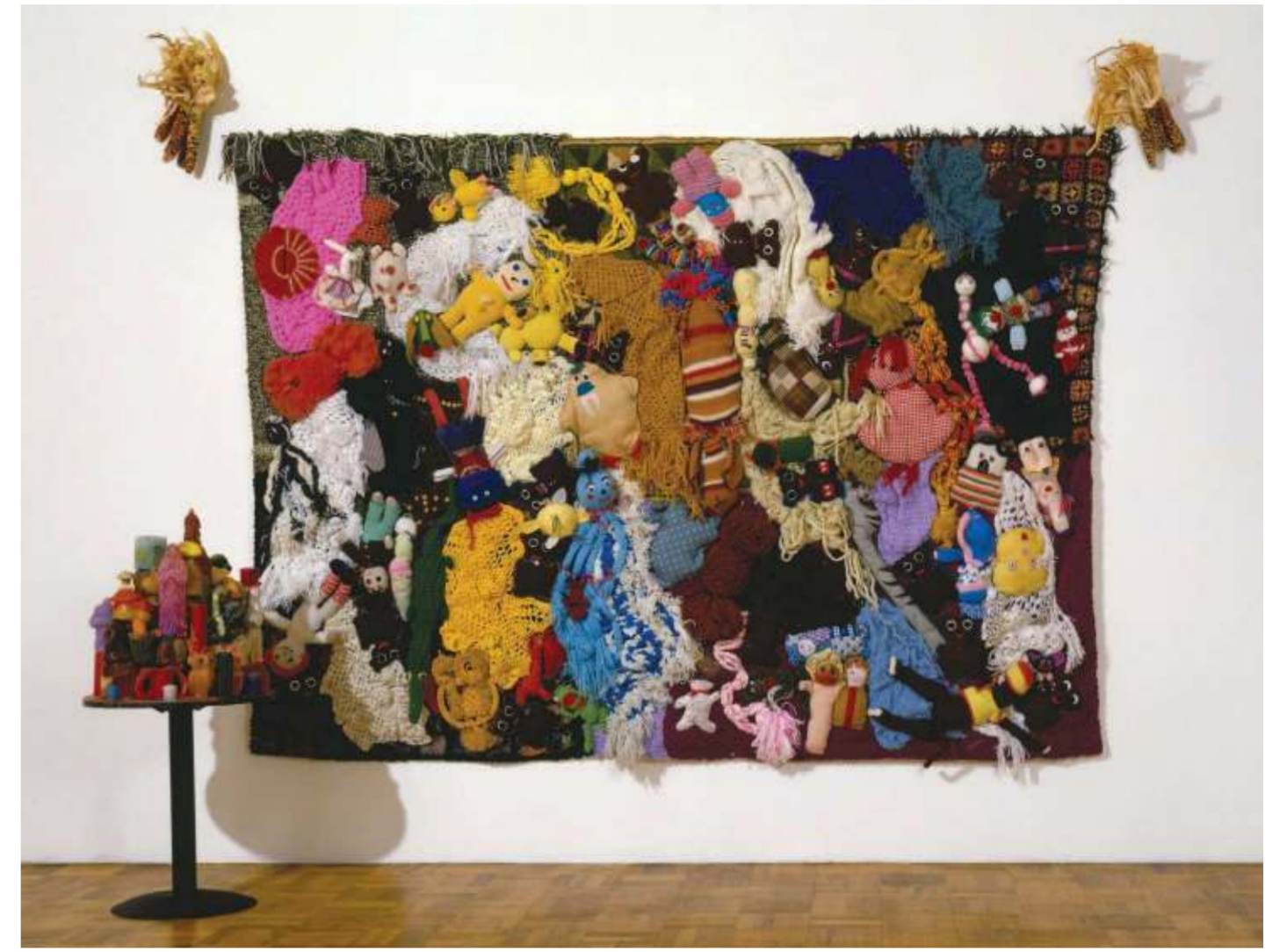
Mike Kelley, More Love Hours Than Can Ever Be Repaid en The Wages Of Sin , 1987. Knuffelbeesten op tapijt en gedroogde maïskolven; kaarsen op hout en metalen basis. Collectie Whitney Museum of American Art, New York. Foto: courtesy Mike Kelley Foundation for the Arts